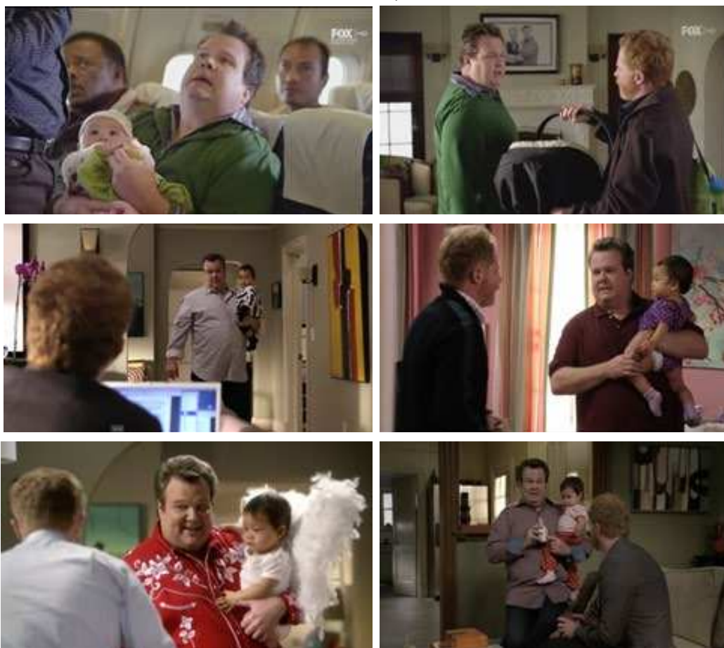
Figura 3. Cameron asume la responsabilidad de cuidar a Lily y actúa de acuerdo al rol femenino de madre y ama de casa