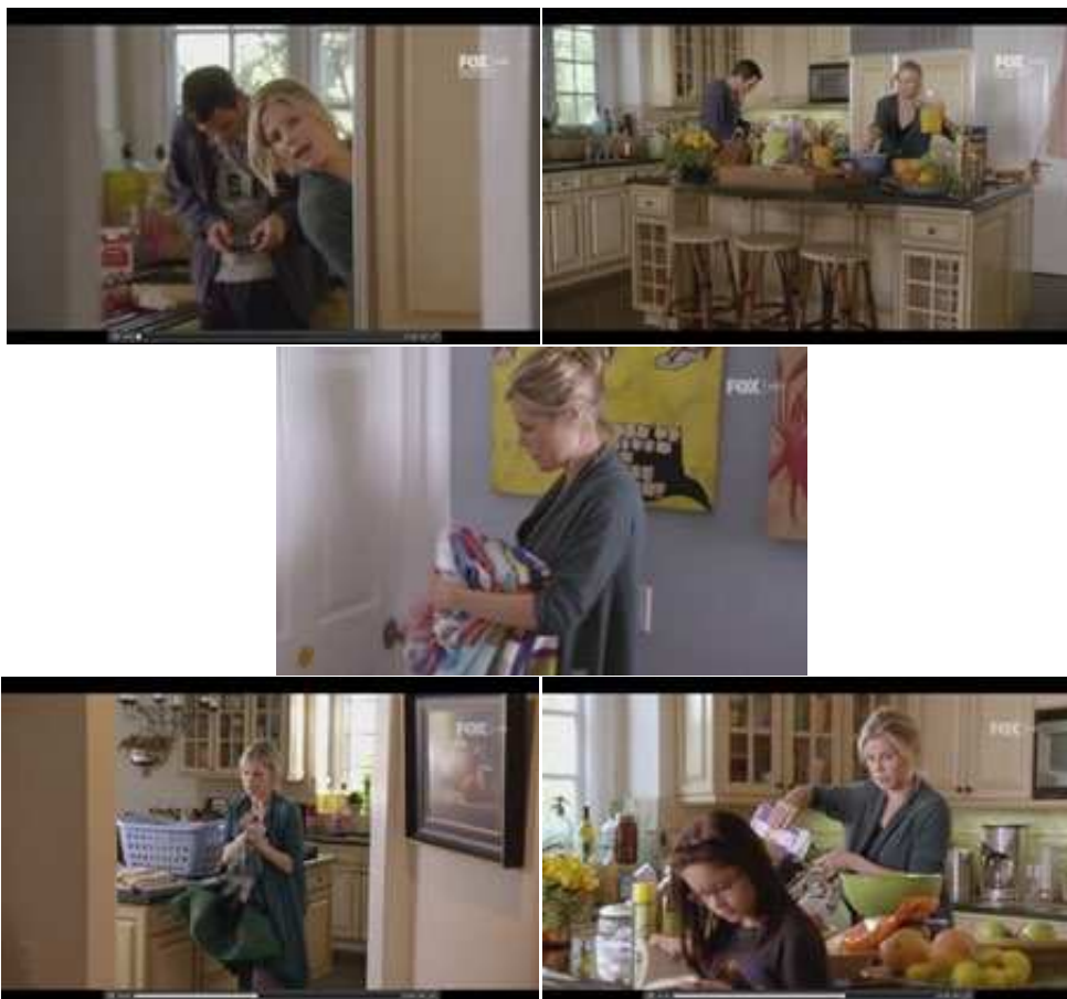
Figura 1. Claire Dunphy realiza las tareas propias del hogar ante la indiferencia de su familia