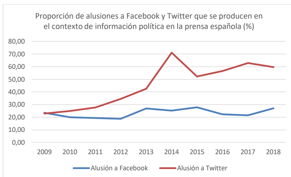
Gráfico 3. Menciones de Facebook y Twitter de la prensa española que se producen en noticias de ámbito político.

El gráfico 3 muestra cómo la prensa ha otorgado también en la esfera política más relevancia a Twitter que a Facebook, con una diferencia que se mantiene bastante estable a lo largo de los años; desde los años iniciales, las menciones de las redes sociales se producen en noticias políticas, dándose en 2014 la máxima relación, año en que los datos indican que un 71% de las alusiones a Twitter se producían en noticias políticas o con protagonistas del mundo de la política: