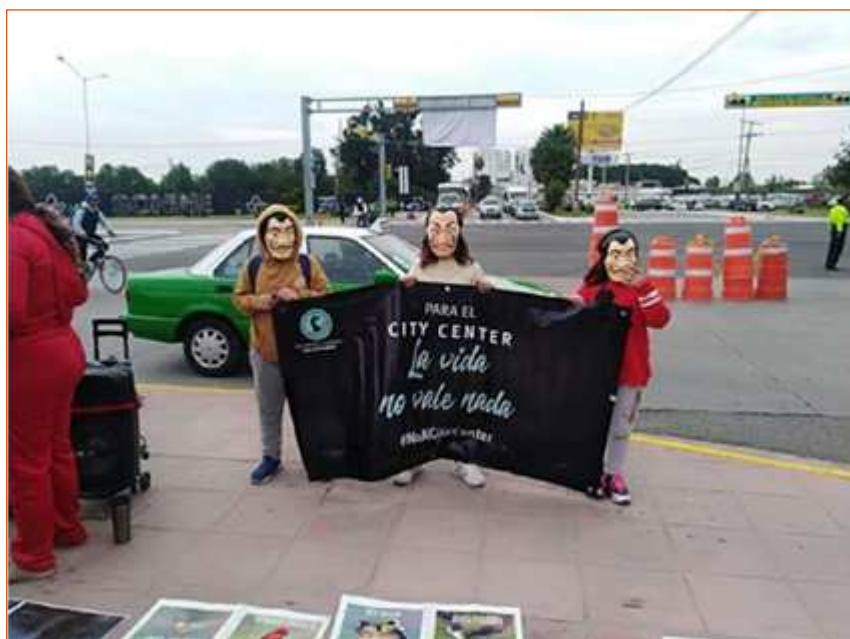
Figura 2.

Estas experiencias permiten observar la utilización de elementos de la cultura mediática, con los cuales las y los activistas se identifican, los apropian y resignifican en su expresión pública.