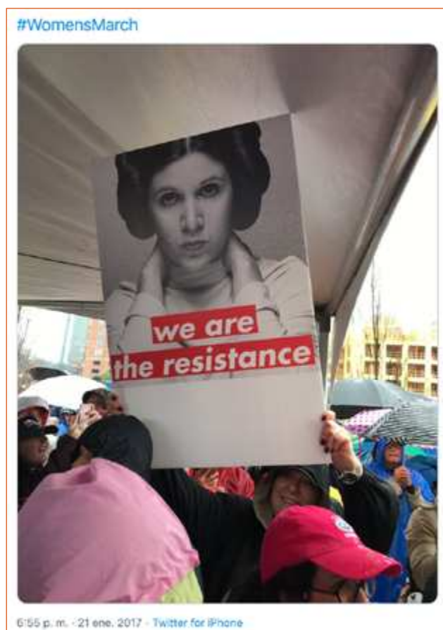
Figura 1. #WomensMarch. Fuente: @IBexWeBex (21 enero 2019)

También en 2017 se estrenó la serie española La Casa de Papel , dirigida por Álex Piña. La historia se transmitió inicialmente por Antena 3 en España y, posteriormente, por Netflix. En ella se aborda un atraco mayúsculo, liderado por El Profesor, para poner en jaque a los poderosos. La serie ha sido apropiada también como símbolo de resistencia. Los disfraces y máscaras que utilizan los personajes han sido empleados en las protestas en Chile, México (ver figura 2), Irak y otros países (Miranda, 2019). Además, en la serie se canta "Bella Ciao", una canción italiana que fue apropiada como símbolo de protesta anti-fascista en Europa desde mediados del siglo XX. Esta canción, que ya había sido empleada en protestas recientes como la Nuit Debout en Francia, ha sido retomada en 2019 a partir de la popularidad de la serie. Así, algunos manifestantes colombianos cantaron "Duque ciao, Duque ciao, Duque ciao" para pedir la renuncia del presidente Iván Duque, mientras que en Irak se ha escuchado también en las protestas contra la corrupción (Carrión, 2019; La República, 2019).