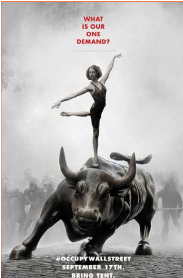
Figura 4. #OccupyWallStreet. Fuente: Adbusters. Julio 2011.

Esto evoca algo que ya había ocurrido en New York, en 2011, cuando Adbusters difundió un cartel al que se atribuye el inicio de Occupy Wall Street . En él se aprecia una bailarina de ballet, sobre la escultura del toro que simboliza a Wall Street (ver figura 4). En la parte superior de la imagen hay una pregunta: “ What is our one demand? ” En la parte inferior, hay una invitación: “ #OccupyWallStreet September 17th. Bring tent ” (Beeston, 2011; Bierut, 2012; Yardley, 2011).