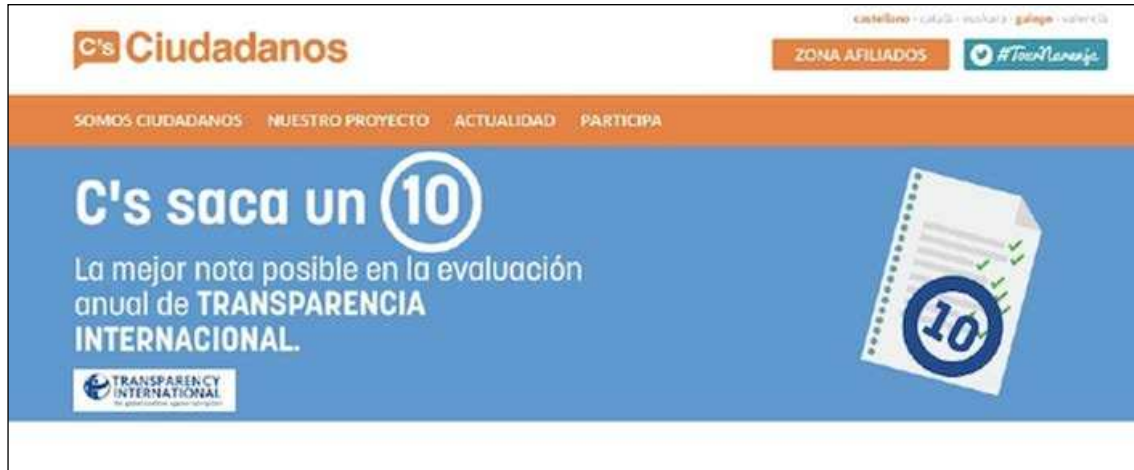
Imagen 3. Portal de transparencia de Ciudadanos

Ciudadanos también incluyó una pequeña referencia a indicadores de cumplimiento de transparencia, aunque únicamente se trataba de una imagen con el 10 que le otorgó Transparencia Internacional.