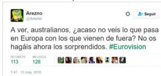
Figura 8. Tuits publicados durante la final de Eurovisión que hacen referencia a la actuación de la Unión Europea durante la crisis de los refugiados

E incluso encontramos referencias a la crisis de los refugiados y la respuesta dada por la Unión Europea (Figura 8).