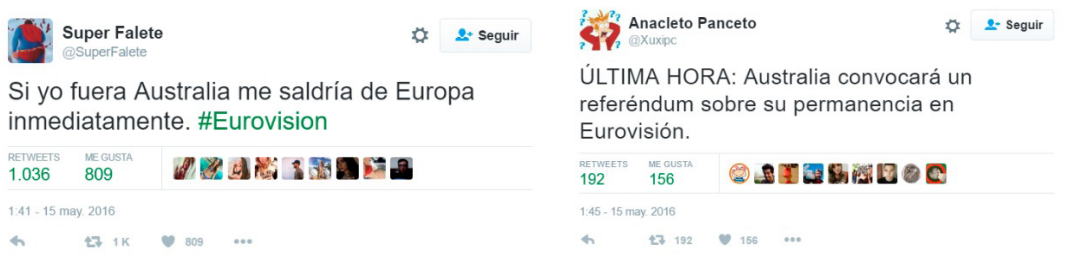
Figura 19. Tuits que bromean sobre la participación de Australia en Eurovisión

Entre las pautas comunes de comportamiento que hemos encontrado en los tuiteros durante el visionado de Eurovisión y del debate electoral, no pasa desapercibida la fijación en celebrar puntos concretos de cada programa. En el caso de la cita de Eurovisión, el acontecimiento más comentado por los tuiteros estudiados es la participación de Australia (Figura 19). De hecho, la presencia de este país es comentada por 13 de los 15 tuiteros estudiados (Tabla 2).