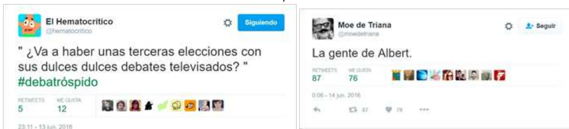
Figura 10. Tuits que hacen referencia a momentos concretos de la serie de animación 'Los Simpson'