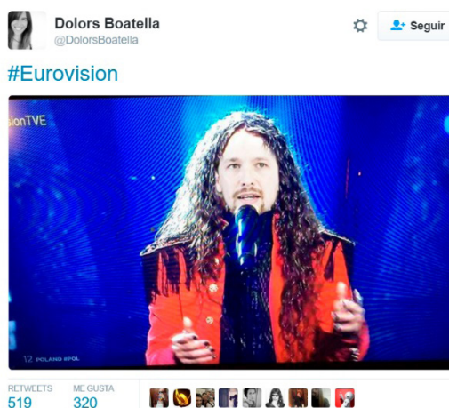
Figura 1. Collage que mezcla una imagen de Pablo Iglesias con otra de un participante en Eurovisión

Curiosamente, estos dos acontecimientos quedan enlazados de forma directa en las imágenes producidas por Boatella, ya que en su seguimiento de Eurovisión publicó un montaje en el que Pablo Iglesias, líder de Podemos, aparecía como participante del concurso musical, debido a su parecido con uno de los cantantes. Por su parte, durante el debate Boatella se hizo eco de uno de los detalles más comentados y celebrados por los tuiteros que hemos analizado: la profusión de post-it empleados por Rajoy y diseminados en su atril.