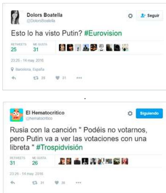
Figura 7. Tuits publicados durante la final de Eurovisión que hacen referencia al dirigente ruso Vladimir Putin