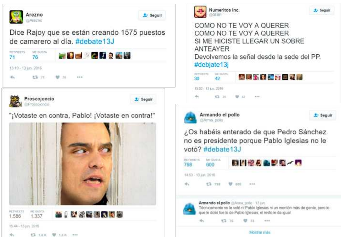
Figura 17. Tuits que bromean sobre algunos de los temas planteados durante el debate electoral

En el primer caso, se produce, en general, una burla a la bajada del paro señalando la creación de empleos de baja calidad, en el segundo se cuestiona la lucha del PP contra la corrupción y en el tercero, encontramos diversas mofas a Pedro Sánchez por su insistencia en recordar que Iglesias no le apoyó (Figura 17).