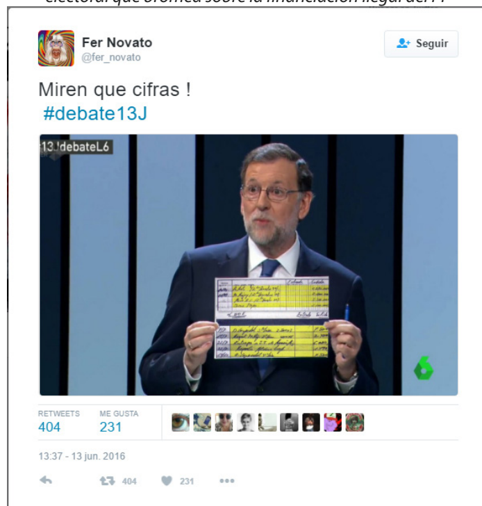
Figura 15. Meme compartido en Twitter durante el debate electoral que bromea sobre la financiación ilegal del PP

Por otra parte, se encuentran aquellos memes que usan la superposición de imágenes como una forma de hacer crítica política. En este espacio encontraríamos imágenes como la siguiente (Figura 15): se trata de un fotograma en la que Mariano Rajoy sostiene un cartel que mostró durante el debate. Sin embargo, su contenido se ha modificado para mostrar la documentación sobre la presunta contabilidad 'B' del PP durante la época de Luis Bárcenas como tesorero del partido.