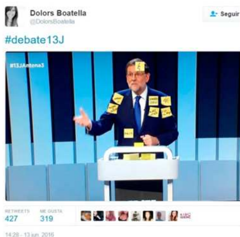
Figura 2. Collage que cubre a Mariano Rajoy de post-it durante su intervención en el debate del 13J.