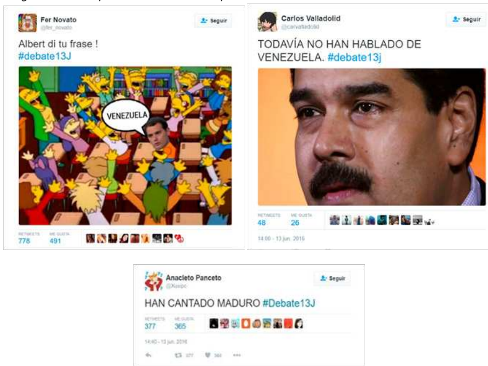
Figura 18. Tuits que bromean sobre la aparición de Venezuela durante el debate electoral