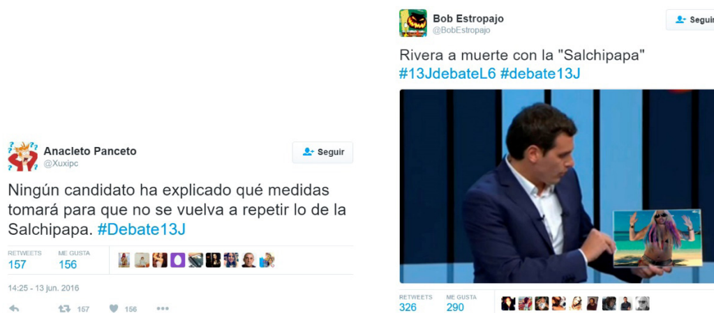
Figura 12. Tuits publicados durante el debate electoral que aluden al videoclip de 'La Salchipapa'