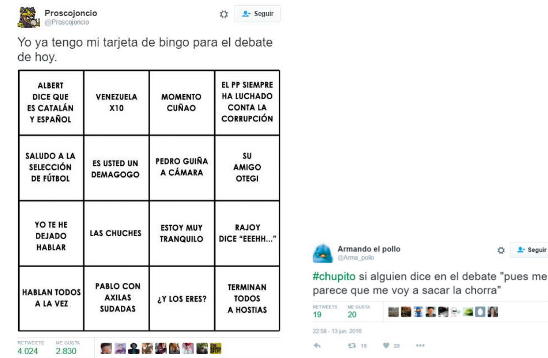
Figura 11. Tuits publicados durante el debate electoral que aluden al juego del bingo de chupitos

También encontramos referencias a los 'bingos de chupitos' (Figura 11), una moda extremadamente popular en Twitter que consiste en elaborar una lista de lugares comunes que probablemente aparecerán durante un evento televisado y celebrar su advenimiento ingiriendo (figuradamente o de forma real) un trago.