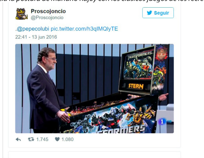
Figura 13. Meme compartido en Twitter durante el debate electoral que asocia la postura de Mariano Rajoy con los clásicos juegos de los recreativos

Así, en el primer grupo encontraríamos imágenes como ésta (Figura 13), en la que Mariano Rajoy aparece jugando a una máquina típica de los salones recreativos y que juega con la postura y la posición de las manos que mantenía el dirigente del PP en ese plano televisivo (como ya hemos subrayado, el lenguaje no verbal es uno de los aspectos más comentados en Twitter).