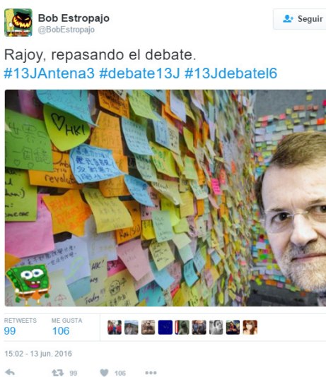
Figura 14. Meme compartido en Twitter durante el debate electoral que bromea sobre los numerosos post-it utilizados por Mariano Rajoy durante su intervención

O esta otra (Figura 14) en las que se mofan de los ya mencionados post-its de Rajoy: