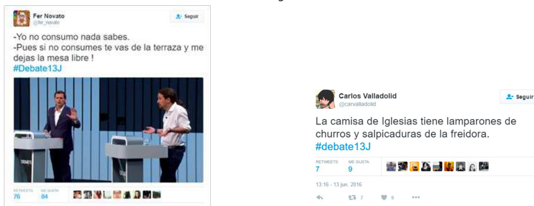
Figura 16. Tuits publicados durante el debate electoral que bromean sobre la vestimenta de Pablo Iglesias

En el festival de Eurovisión, los comentarios se centran principalmente en la vestimenta de la pareja que anunciaba los puntos otorgados por Polonia y el collar de la presentadora australiana. Mientras que, en el caso del Debate Electoral, fue la apariencia de Pablo Iglesias la que acaparó más comentarios. En particular, muchos de los tuitstars criticaban su camisa por considerarla inapropiada para una cita política y la comparaban con el uniforme que suelen llevar los camareros en algunos bares (Figura 16). También fueron objeto de comentarios la postura de Albert Rivera aferrado al atril o las ya comentadas manos en posición de jugar al pinball de Rajoy.