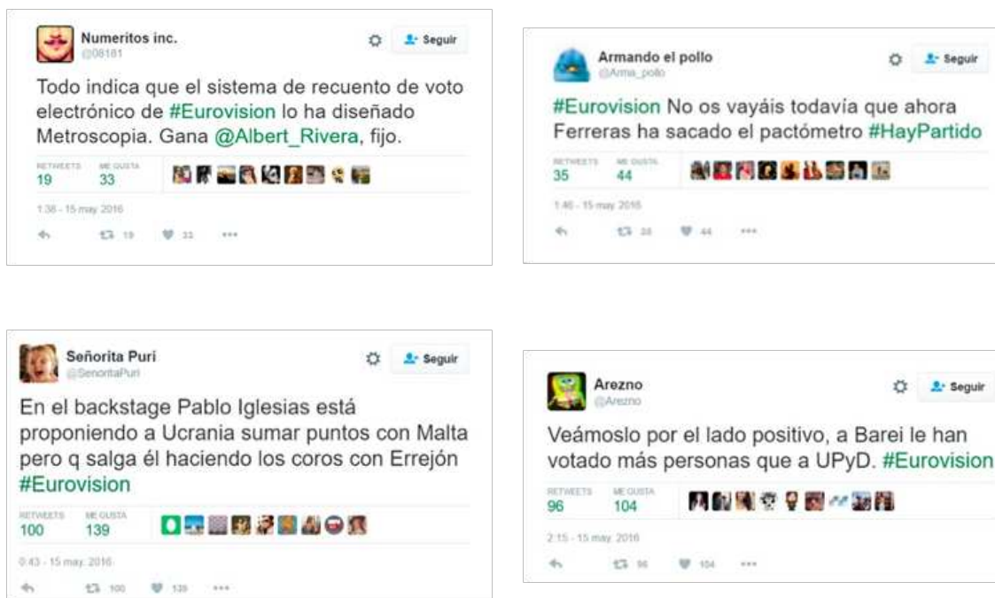
Figura 4. Tuits publicados en la final de Eurovisión que incluyen referencias y juegos de palabras sobre la actualidad electoral

En especial, hallamos un importante volumen de referencias a las encuestas de Metroscopia, los posibles acuerdos electorales adaptados al panorama de Eurovisión y los resultados de los anteriores comicios celebrados en diciembre (Figura 4).