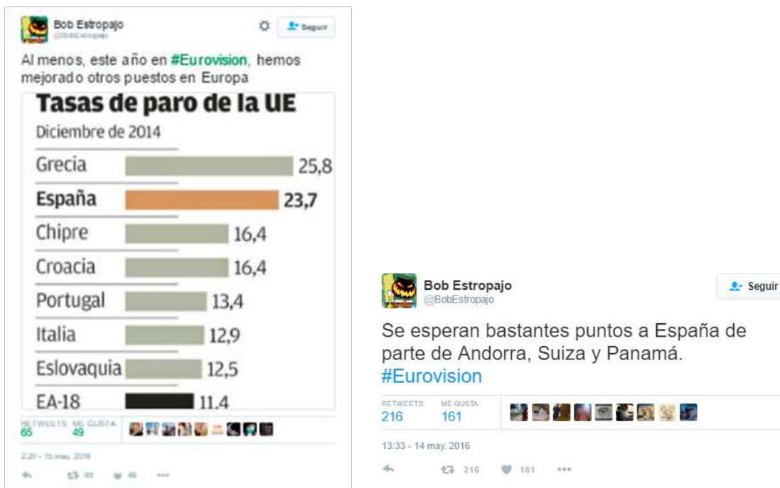
Figura 5. Tuits publicados durante la final de Eurovisión y que incluyen referencias a la corrupción o el paro en España