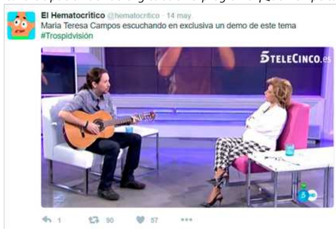
Figura 6. Participación de Pablo Iglesias en el programa '¡Qué Tiempo tan feliz!'

En otros casos simplemente se entremezclan la actualidad de Eurovisión y la política para crear un contraste humorístico (Figura 6).