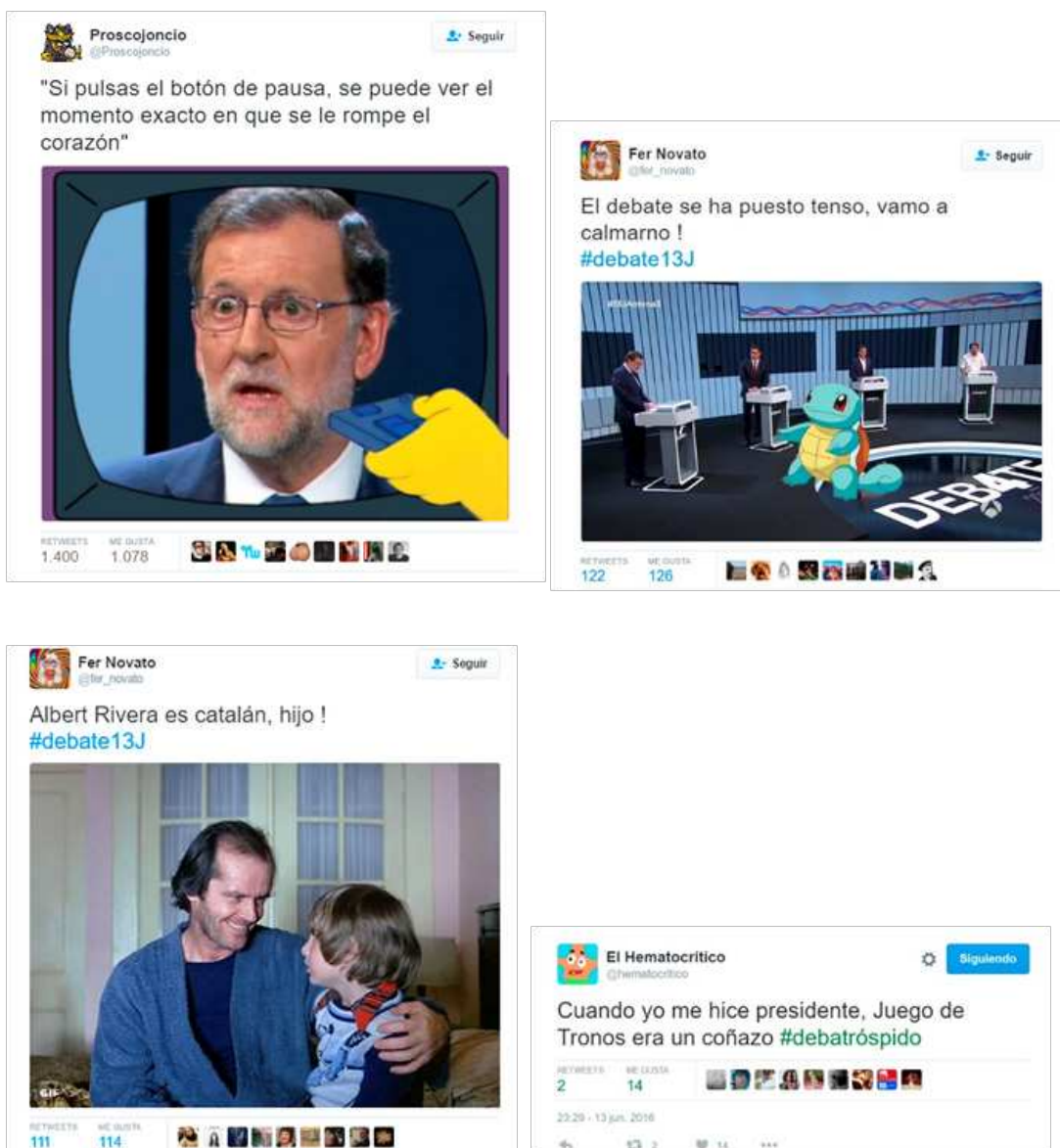
Figura 9. Tuits publicados durante el debate electoral que aluden (de izquierda a derecha y de arriba a abajo) a 'Los Simpson', 'Pokémon', 'El Resplandor' y 'Juego de Tronos'

Y si en el visionado de Eurovisión se colaba la actualidad política nacional, en el debate electoral son frecuentes los recursos de la cultura de masas, empleados por 13 de los 15 tuiteros estudiados (Tabla 2). Así, encontramos una gran presencia de referencias a productos de entretenimiento tan populares como la serie de animación Los Simpson , Juego de Tronos , El Resplandor o Pokémon (Figura 9).