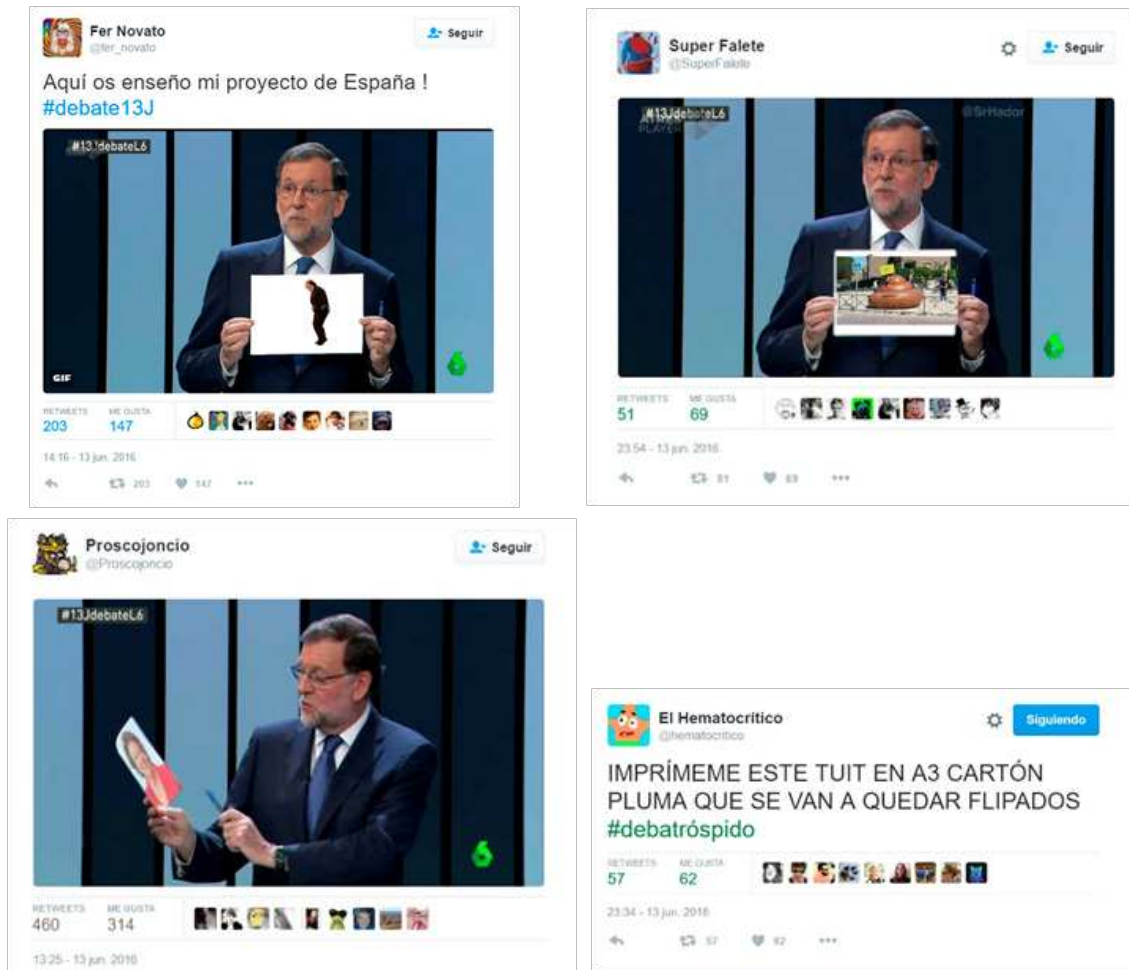
Figura 20. Tuits que bromean sobre el uso de carteles por parte de los candidatos durante el debate electoral